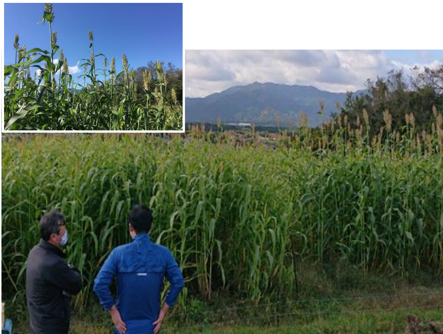
ソルガム栽培実証@三重大学農場 （2020年度）