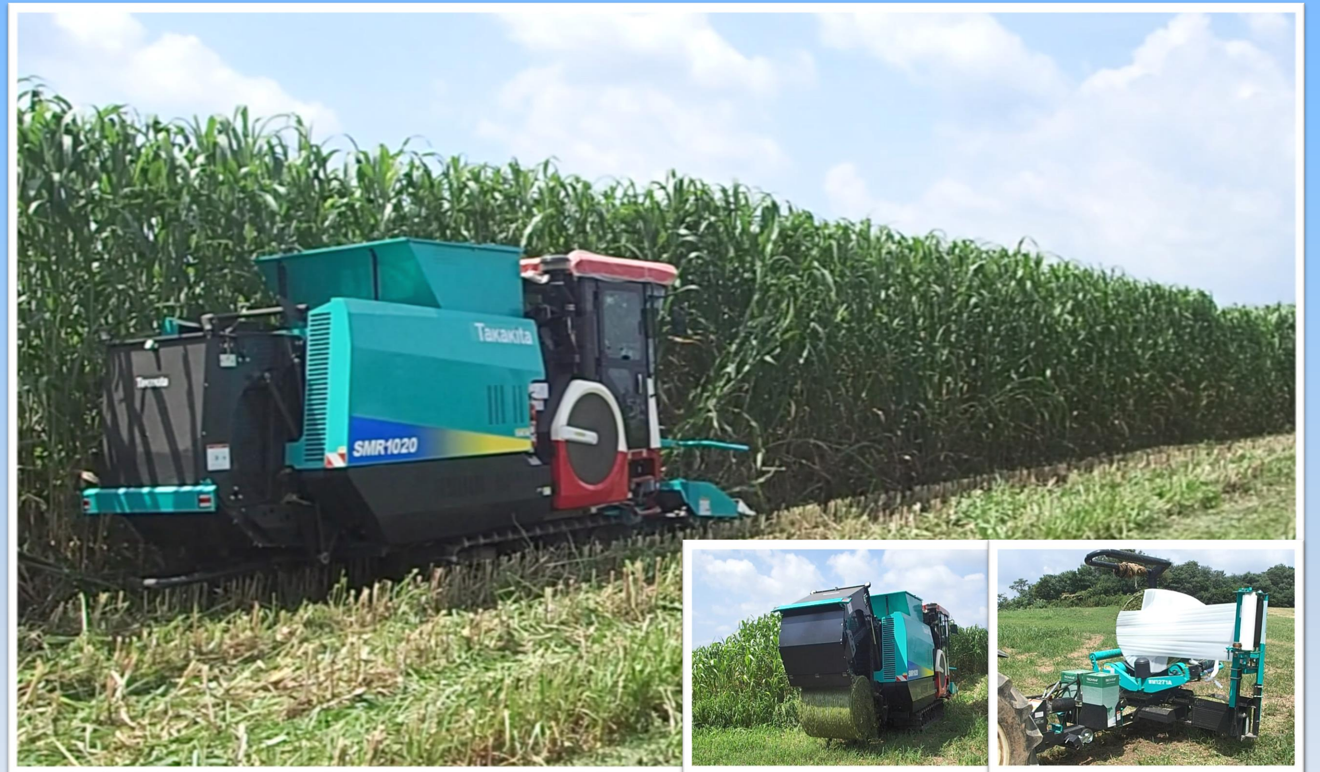
ソルガム栽培実証@名古屋大学農場（2022年度）