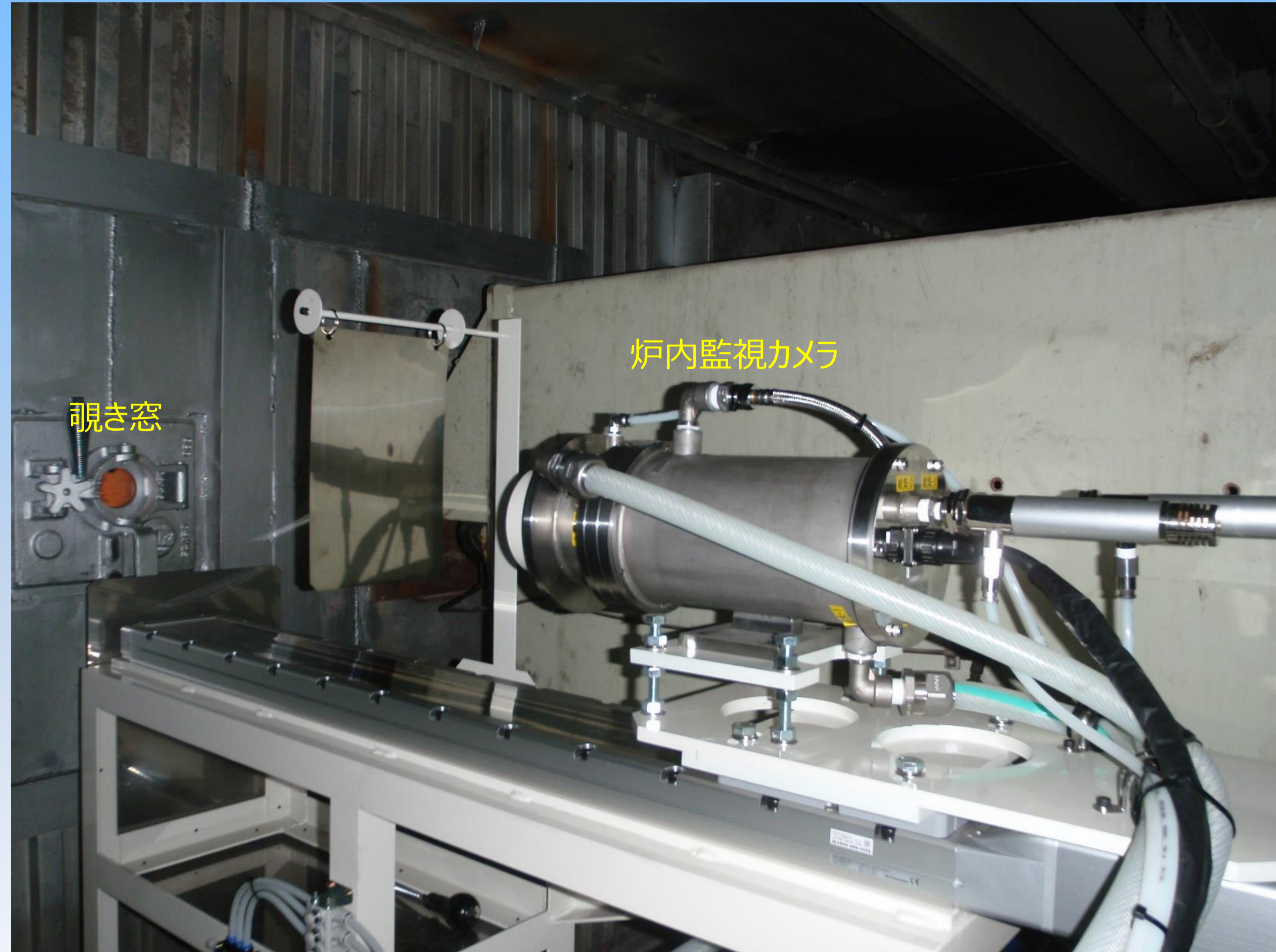
炉内監視カメラの外観