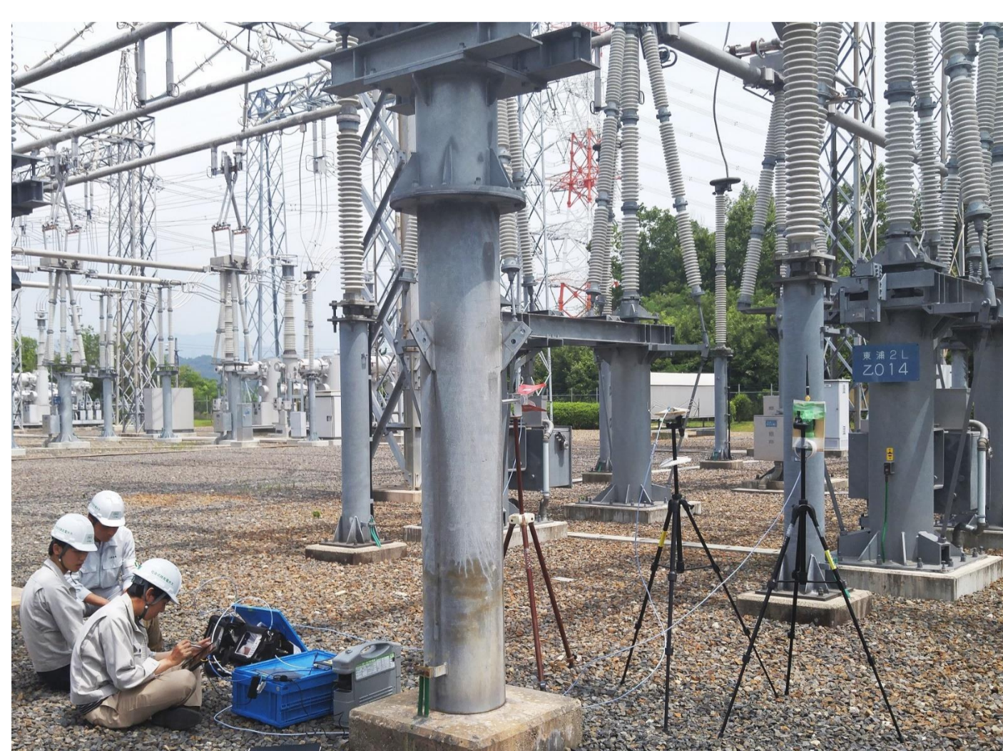
変電所 ノイズ環境調査・通信実験