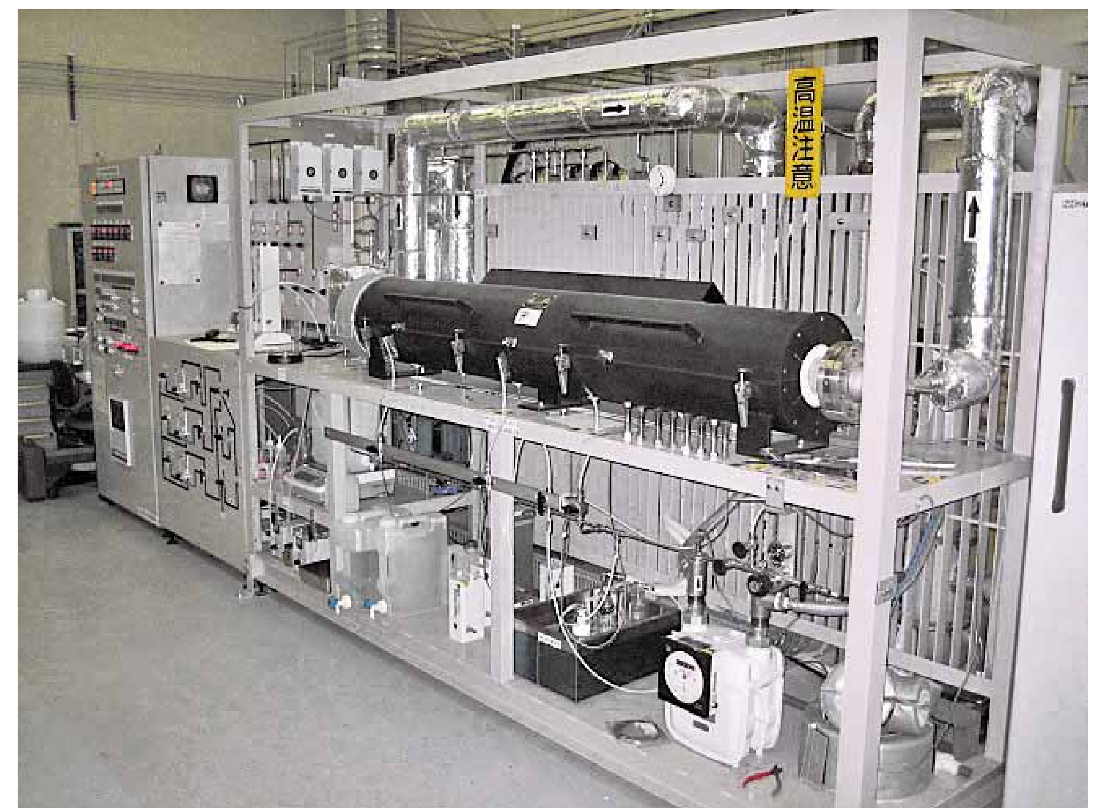
■ NOx除去性能試験装置