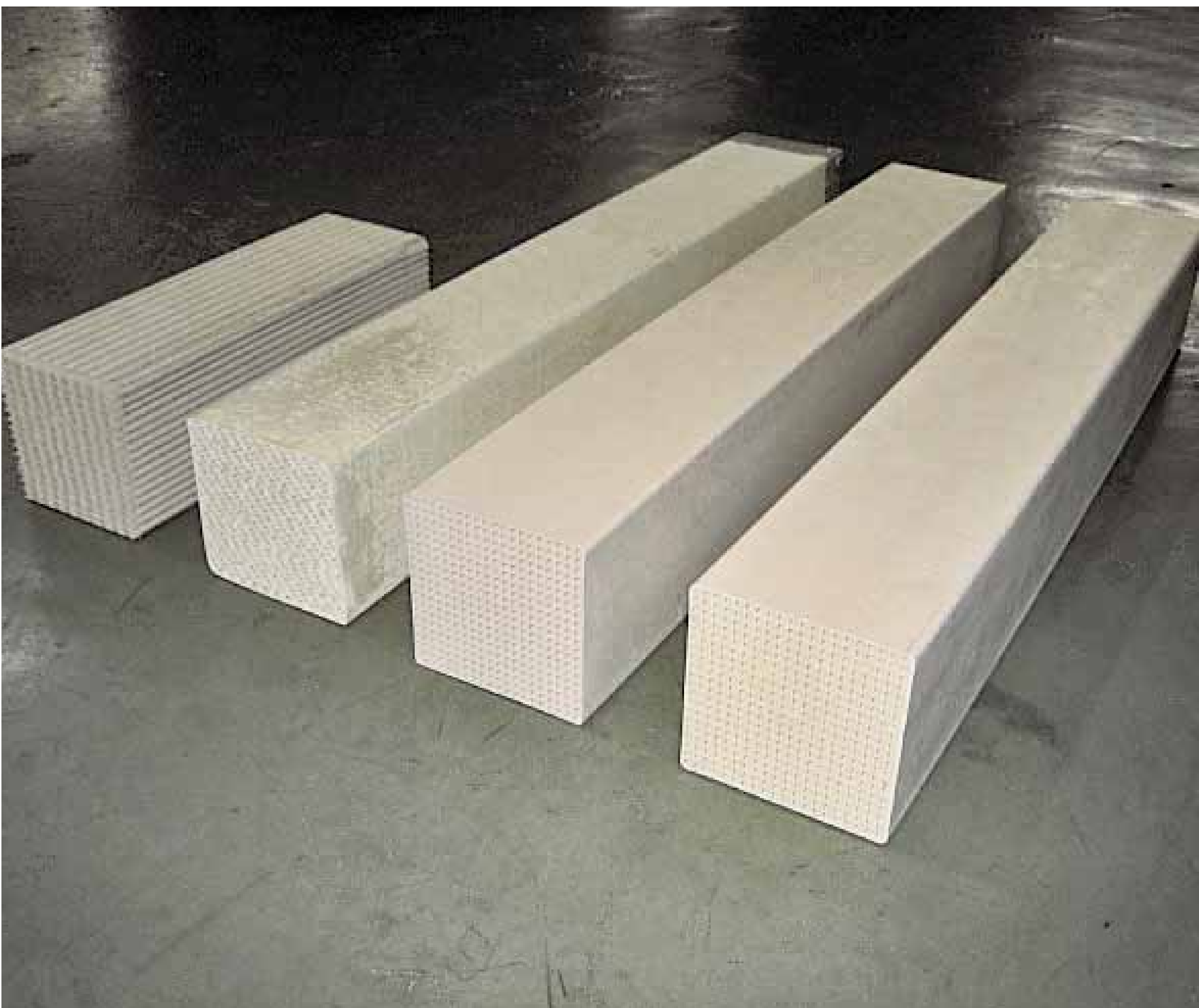
■ 評価中の脱硝触媒