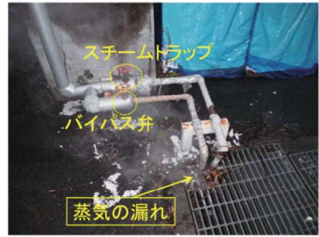
第4図 スチームトラップの故障(バイパス開放による蒸気漏洩)