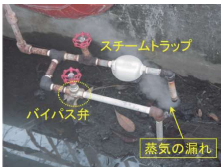
第3図 スチームトラップの故障(弁故障による蒸気漏洩)