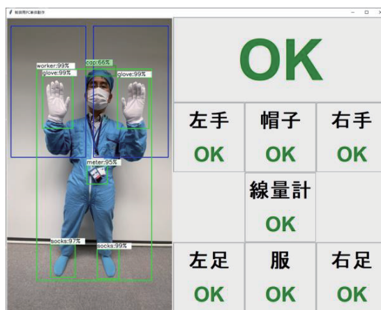
第2図 物体検出の動作例(数値は検出の確信度)

を用い、作業員の画像から各チェック対象の有無を検出する機能を実現した。チェック対象である認識カテゴリとして、保護衣(青服または作業着)、帽子、手袋、靴下、線量計を設定した(第1図)。また、「負例」(リジェクトすべきカテゴリ)として、素手と下着の2カテゴリを設定した。物体検出とチェック機能の実装はオープンソースとPythonの各種ライブラリを用い、独自開発を行った(第2図)。