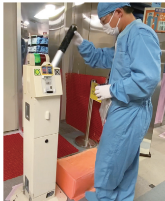
第3図 現行の手動ゲート

発電所では、放射線管理区域への入域時に、線量計の所持を確認する手動ゲートを設置している。現行の運用では、このゲートの手前で、鏡を見て保護具の装備をセルフチェックする。その後、線量計の確実な所持確認のため、線量計をゲートに当てると、ゲートのロックが外れて、作業員がゲートを手で持ち上げてゲートを通過する仕組みを用いている。（第3図）