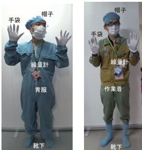
第1図 決められた保護具の装備

そこで、保護具の装備確認を人工知能(AI)により判定する機能の開発に取り組んだ。