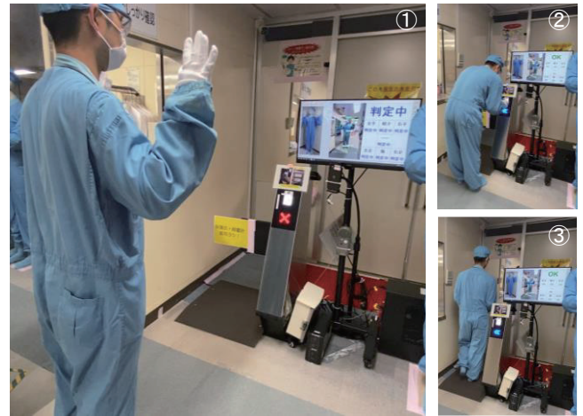
第4図 AIと連動した自動開閉ゲート（浜岡3号機）

計を除く保護具を確認し、線量計の所持は、ゲートのQRコードの読み取り機能で所持確認することもできるものを開発した。なお、システム故障時は、ゲート単体で線量計のみの所持を確認することもできる。