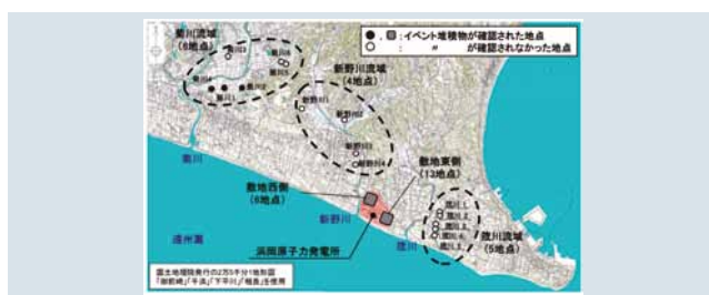
第1図 菊川、新野川および箴川流域の調査地点

現地調査は約8か月間わたり行った。調査地点においてボーリング調査を実施し、採取した試料の観察、放射性炭素( 14 C)年代測定、珪藻化石分析などにより、当時の堆積環境などを踏まえた検討を行い、イベント堆積物(高潮や洪水、土石流など津波以外の要因も考えられるものの、津波起因の可能性もあると評価した堆積物)を抽出した。