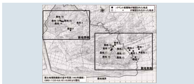
第2図 敷地西側および東側の調査地点および調査結果