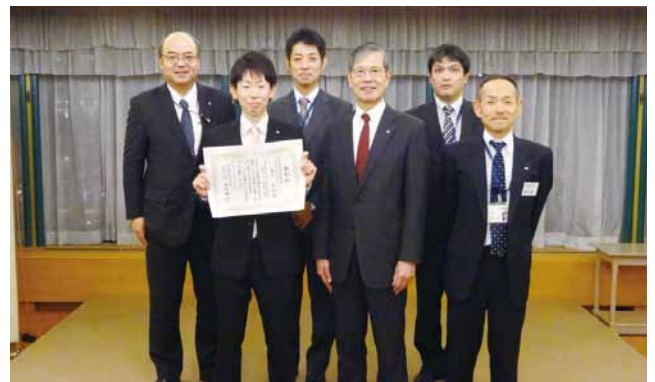
技術研究開発 本部長賞