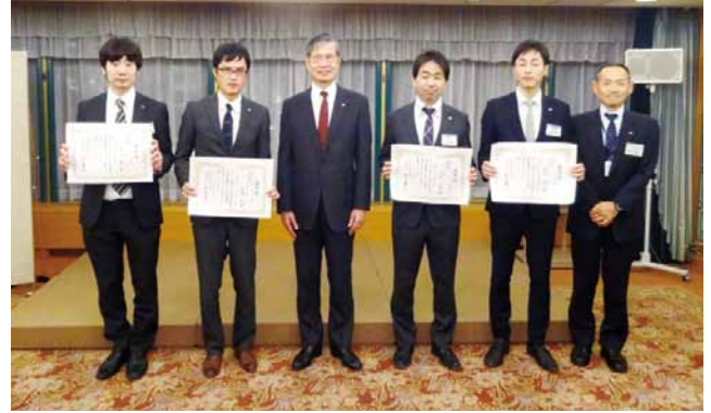
全社技術研究発表会ポスターセッションの部 優秀賞