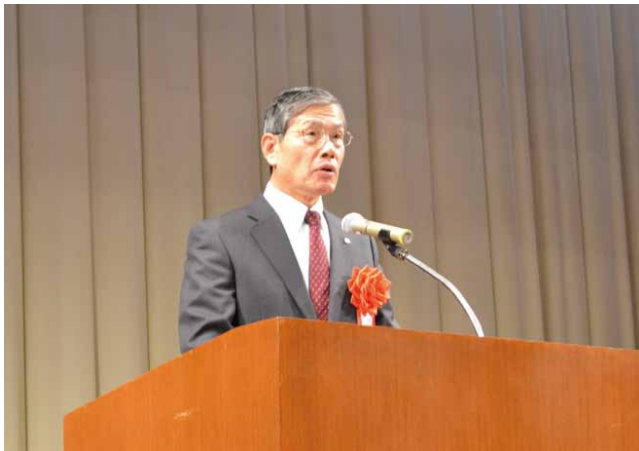
社長 冒頭あいさつ

平成26年12月3日、中電ホールにて「平成26年度技術研究開発賞選考発表会(以下、開発賞)」および「第67回全社技術研究発表会(以下、発表会)」が開催されました。