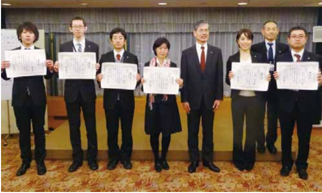
全社技術研究発表会ステージ発表の部 優秀賞