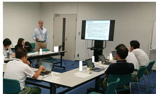
EPRI 技術者との情報交換の様子