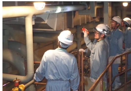
追加で設置した配管および弁の点検の様子

注 1 自主的に取り組んできた重大事故対策や、2013 年 7 月に施行された原子力規制委員会の新規規制基準を踏まえ追加した対策工事などのことです。