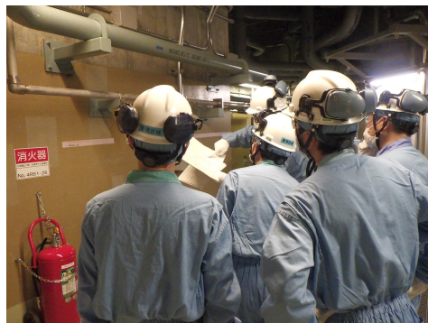
低圧代替注水系の点検の様子