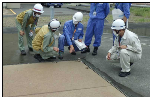
3号試掘坑の整備状況を確認いただいている様子