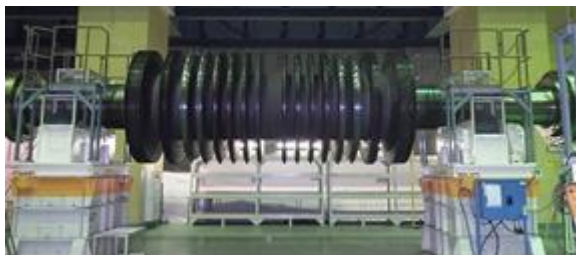
タービンロータの車軸の写真(1軸)

放射線測定装置を用いた測定および評価の結果、確認申請対象物の放射能濃度(コバルト(Co-60))は、法令で定められる基準値を超えていないことを確認しました。