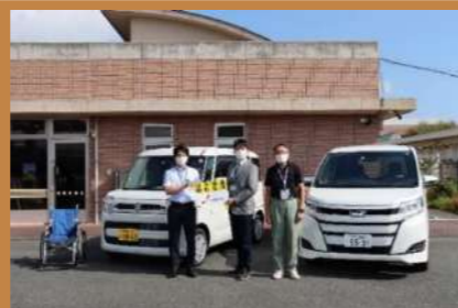
10月12日 東海清風園（御前崎市）

当社は今年度、 原子力災害時に避難行動要支援者の避難支援をおこなうために準備する福祉車両を御前崎市10台、牧之原市6台、掛川市4台、菊川市3台 配備する計画です。10月12～14日、御前崎市8台、牧之原市1台、菊川市2台を各市内福祉施設等に配備しました。この福祉車両は平常時にも社会福祉・医療などで有効に活用いただきます。今後も国、県、市との連携を深め、皆さまの安全確保に向けて継続的に取り組んでまいります。