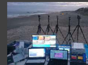
発電所外部火災の早期検知技術に関する研究