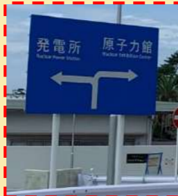
経路案内標識 (国道側から撮影)