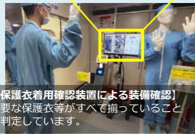
【保護衣着用確認装置による装備確認】必要な保護衣等がすべて揃っていることを判定しています。