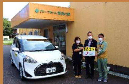
10月14日 グループホーム相良の家（牧之原市）