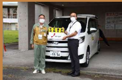
10月13日 プラザけやき（菊川市）