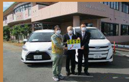
10月14日 御前崎市社会福祉協議会（御前崎市）