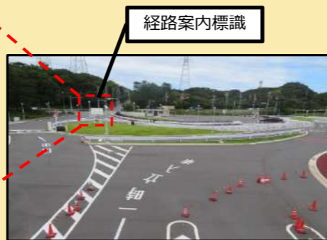
敷地内道路等の整備状況 (正門から国道側を撮影)