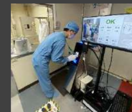
AIを活用した保護衣の装備確認