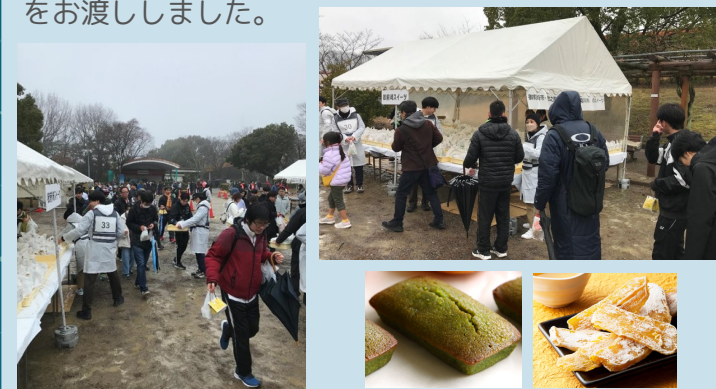
▲ プレゼントを受け取るマラソン完走者 提供したスイーツの一部 ▶

1月20日、愛知県犬山市の野外民族博物館リトルワールドにて、中部電力の全社駅伝競走大会「CHUDEN RUNNING FESTA」が開催されました。 目玉イベントの一つである「ごほうびマラソン」には約1,200人が参加し、完走者へのプレゼントとして、御前崎市・牧之原市・掛川市・菊川市のスイーツをお渡ししました。