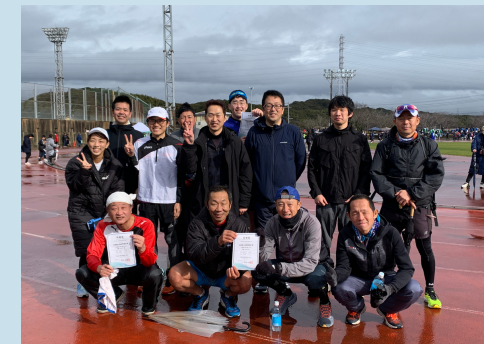
▲ 1月21日 御前崎市駅伝大会

地域の駅伝大会に、当社社員も参加しました。 参加した社員は、地域の皆さまとも競い合っ、タスキをつなぎながらゴールを目指しました。 当社はこれからもお客さまとのコミュニケーションを大切にし、地域のイベントへ積極的に参加してまいります。