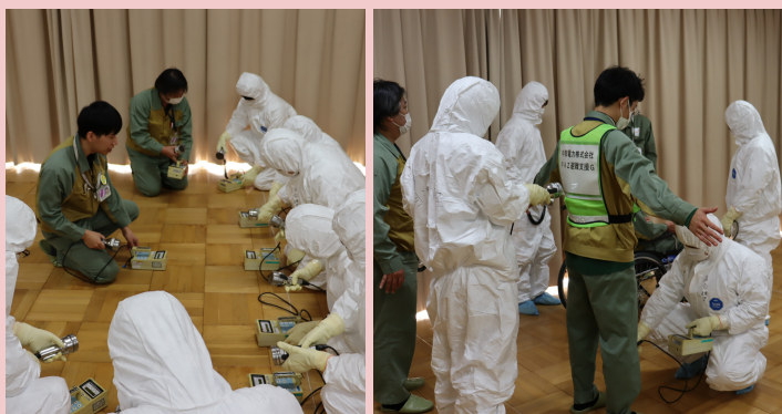
▲ 放射線測定器を使った表面汚染測定の様子

1月17日、18日に実施された菊川市職員を対象とした「放射線防護施設稼働訓練」に、当社社員も参加しました。 当社社員から参加者の皆さまに対して、放射線の基礎知識・放射線防護装備に関する講義や防護服の着用・放射線測定器を使った実技訓練をおこないました。 当社は、今後も引き続き原子力災害に備えた防災体制の充実・強化に取り組んでまいります。