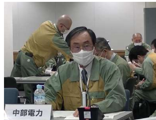
オフサイトセンター運営訓練の様子