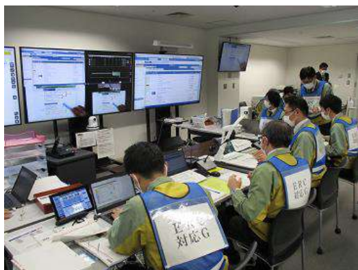
原子力規制庁連携訓練の様子