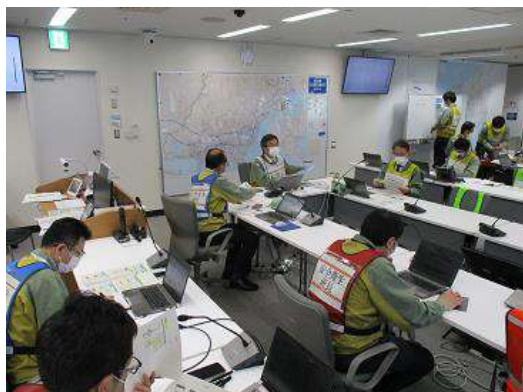
本店本部運営訓練の様子