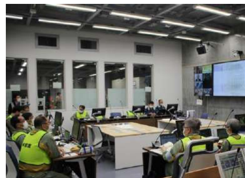
発電所本部運営訓練の様子