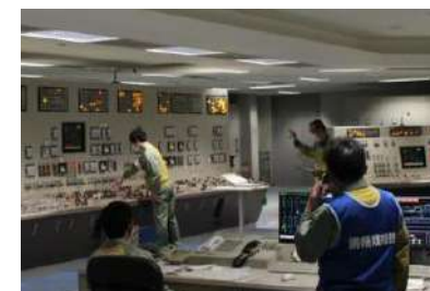
運転訓練シミュレータでの様子