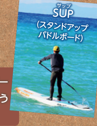
SUP (スタンドアップパドルボード)

ヨットとサーフィンを合わせたようなスポーツだよ。セイル(帆)に風を受けて、水面を走るんだ。