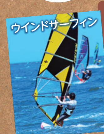
ウィンドサーフィン

ヨットとサーフィンを合わせたようなスポーツだよ。セイル(帆)に風を受けて、水面を走るんだ。